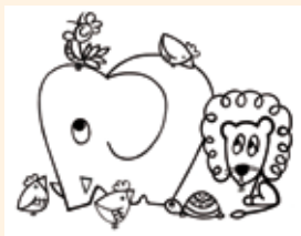
Kleurplaat Carnaval der Dieren (Tekening Gerard de Bruyne).