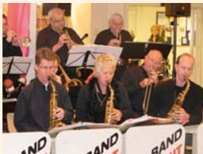
Bigband Straight Life.

Zaterdag 26 mei Leidschendam Theater Camuz, Damlaan 44, 16.00 - 17.00 uur